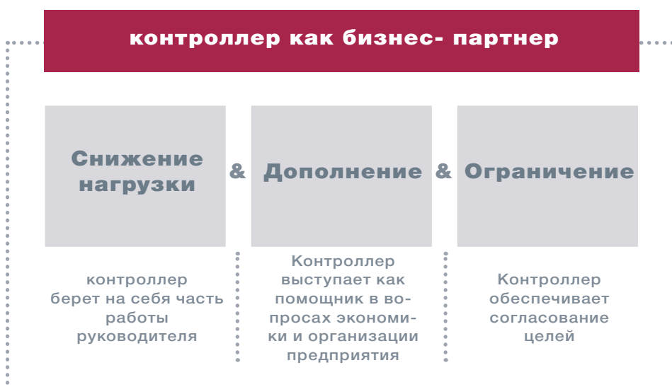
Рис. 3. Поддержка менеджера контроллером (по Веберу/ Шефферу)

С точки зрения бизнес-партнерства, сотрудничество менеджера и контроллера должно реализовываться «на равных». Хотя направление деятельности задает менеджер, сегодня контроллер также несет ответственность за достижение целей предприятия. Таким образом, контроллеру не следует пассивно ждать указаний руководителя; его роль как бизнес-партнера для менеджера заключается в упреждении и дополнении действий последнего . Это относится как к ежедневным обязанностям, так и к принципиально новым сферам деятельности, например, таким как ориентация на управление стоимостью или устойчивостью функционирования предприятия. Роль контроллера как бизнес-партнера заключается в распознавании и развитии подобных тем. При этом, с одной стороны, все большее значение придается способности контроллера совмещать активное участие в управленческом процессе с внесением собственных идей, а с другой, выполнять функцию блюстителя интересов предприятия и критически настроенного партнера или «спарринг-партнера» («вовлеченность или независимость»). Контроллеры должны быть в состоянии усидеть на двух стульях.