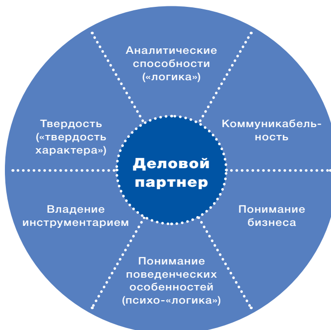
Рис. 4. Основные компетенции контроллеров

Контроллеры, желающие достойным образом оказать поддержку менеджерам, должны обладать широким диапазоном способностей, которые можно разделить на шесть основных компетенций. Они также лежат в основе «классической» модели требований Альбрехта Дайле, хотя для контроллера как бизнес-партнера менеджера они приобрели еще большее значение.