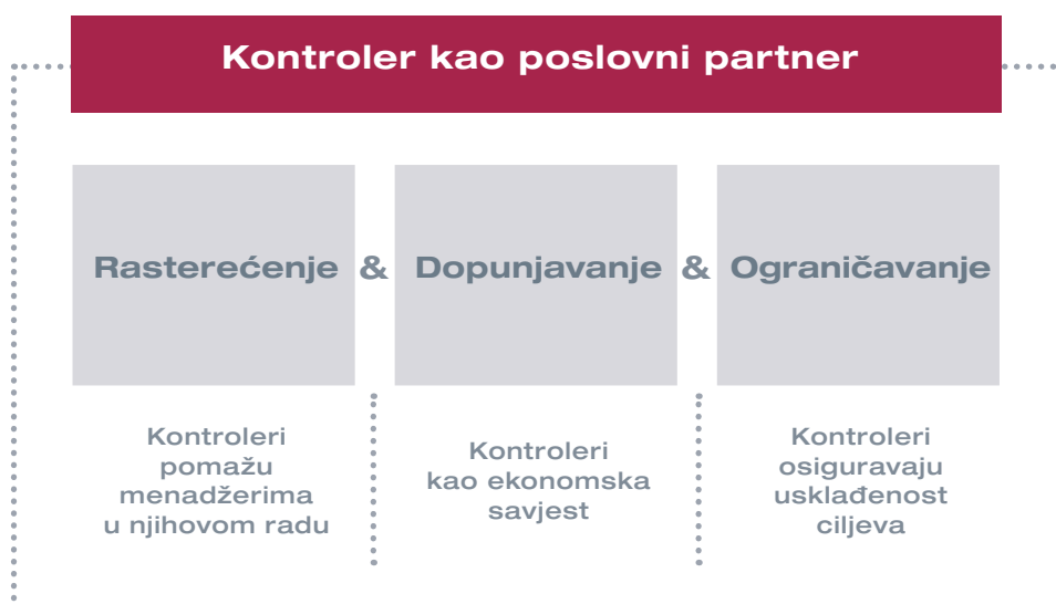
Slika 3: Potpora upravljanju od strane kontrolera prema: Weber / Schäffer

Suradnja između menadžera i kontrolera u ovoj vrsti poslovnog partnerstva trebala bi biti zasnovana na ravnopravnoj osnovi. Doduše, menadžeri su odgovorni za određivanje smjera za postizanje ciljeva poduzeća, ali isto tako u današnje vrijeme kontroleri za to imaju također suođgovornost. Stoga kontroleri ne bi trebali pasivno čekati na upute menadžera, nego djelovati kao proaktivni i komplementarni partner menadžmenta. To se odnosi kako na rutinske poslovne aktivnosti, tako i na nove temeljne razvojne inicijative, npr. uspostavljanje orijentacije prema dodanoj vrijednosti ili održivosti u korporativnom upravljanju. Središnji aspekt uloge poslovnog partnera je prepoznati i unaprijediti takve teme. Pri tome je iznimno važno da kontroleri postignu ravnotežu između aktivnog sudjelovanja u procesu upravljanja u koji unose vlastite ideje s jedne strane, dok je s druge strane njihova restriktivna funkcija čuvara interesa poduzeća i kritički nastrojen partner ili sparing-partner ("uključenost nasuprot neovisnosti"). Kontroleri moraju biti u stanju "nositi dvije kape".