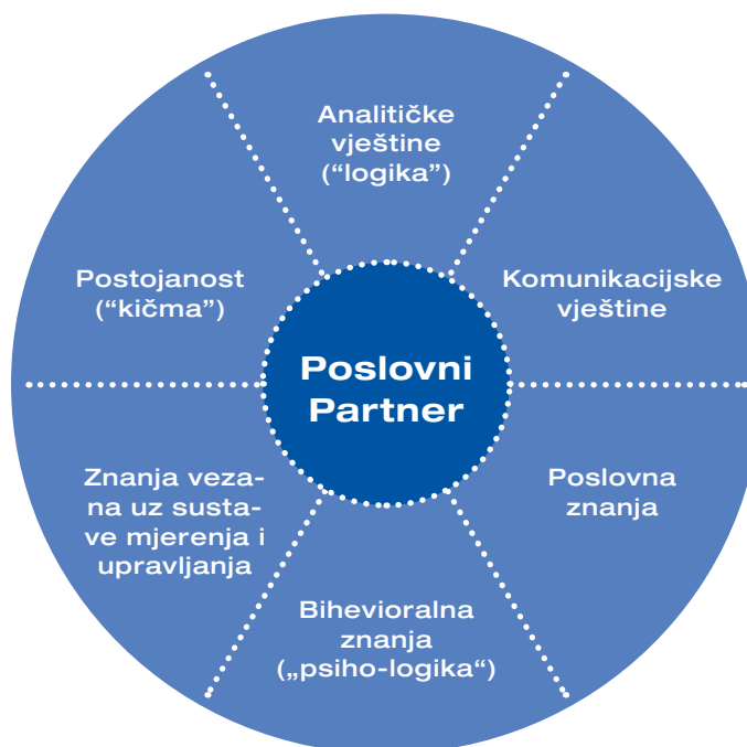
Slika 4: Ključne kompetencije kontrolera

Ako kontroleri žele pružiti sveobuhvatnu potporu menadžerima, trebaju imati široki raspon vještina koje se mogu svesti na šest ključnih kompetencija. Ovo je klasična shema zahtijevanih kompetencija prema Albrechtu Deyhleu koja svakim danom postaje sve važnija za kontrolera kao poslovnog partnera: