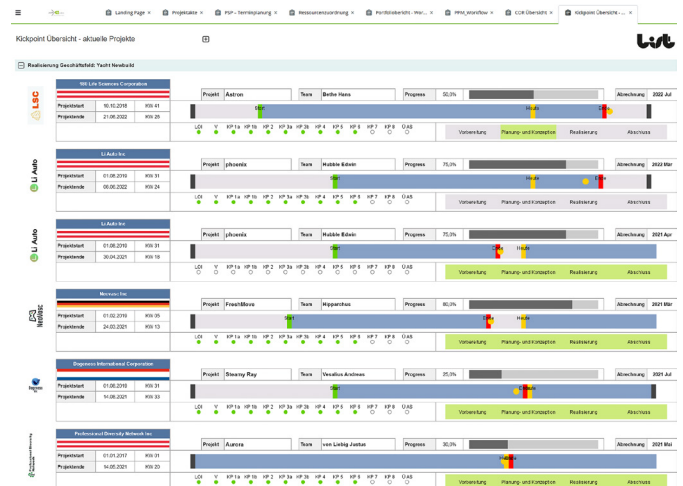
Kickpoint Übersicht Bericht